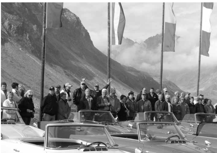
Gruppenbild Silvretta-Hochalpenstraße Bieler Höhe 2034 m ü. N.N.

Freuen wir uns jetzt auf das Treffen in Coburg!