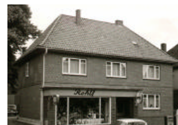
Der Betrieb in der Poststraße Trittau in den 50er Jahren