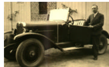
Walter Rohlf - Im Hintergrund, altes NSU- Firmenwappen an der Wand